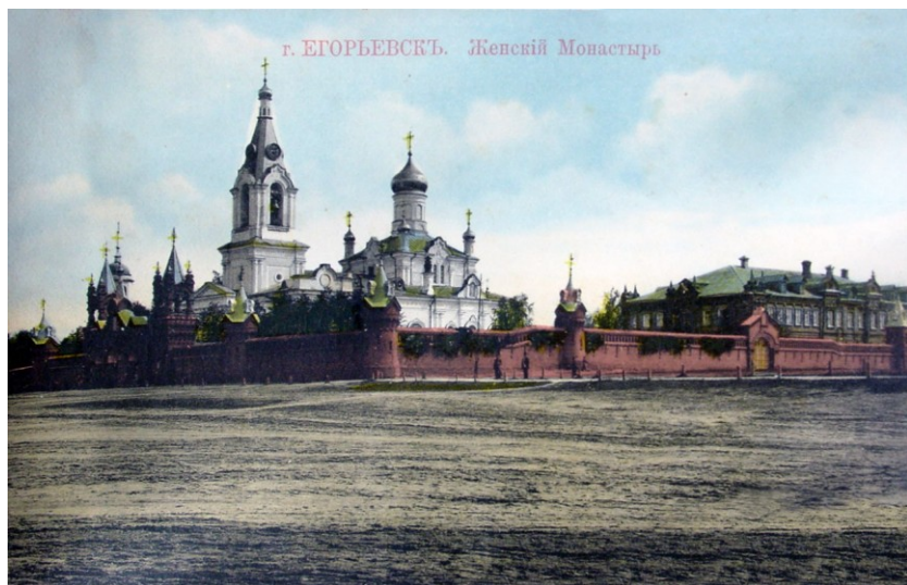
монастырь в Егорьевске.