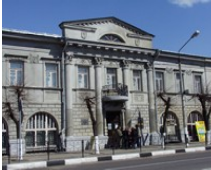
Егорьевский историко-художественный музей, бывший дом купцов Никитиных.